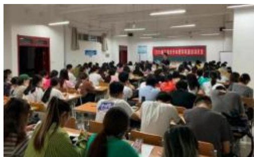
“清新学风 诚信考试”专题班会