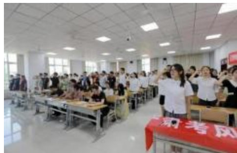
学风建设月启动仪式集体宣誓、签订《德州学院诚信考试承诺书》