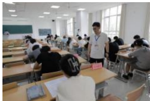
“我为师生办实事”高数课程指导讲座 “党员考场亮身份，诚信考试做表率”